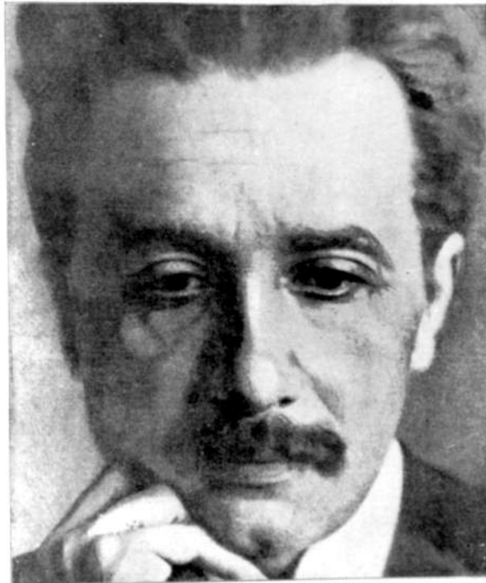
EINE NEUE WEISE DER DRITTELMILIARDEN: ALBERT EINSTEIN. Seine Gedanken sind nicht nur in der Wissenschaft, sondern auch in der menschlichen Seele, haben sich tief verankert.

14. Dezember 1919 Nr. 50 79. Jahrgang Berliner Einzel- Preis 25 Pfg. Illustrierte Zeitung Verlag Ullstein & Co., Berlin SW 68